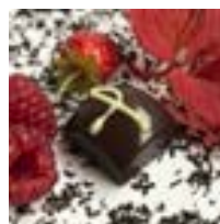
GANACHE Thé fruits rouges