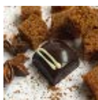
GANACHE Pain d'épices