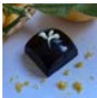
PRALINE Yuzu Normand

Sept nouvelles recettes pour vous surprendre et réchauffer les soirées d'hiver.