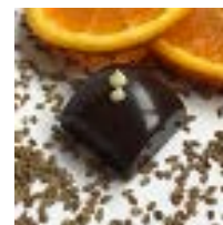
PRALINE Anis vert & confit d'oranges