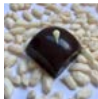
PRALINE Riz Soufflé